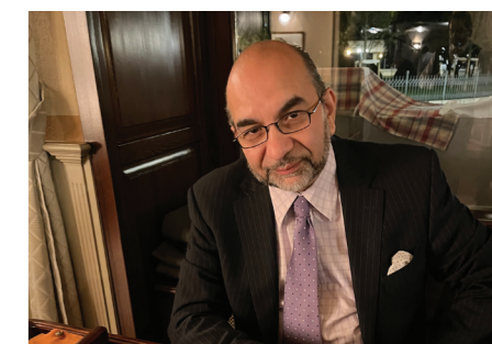
László Rácz © László Rácz