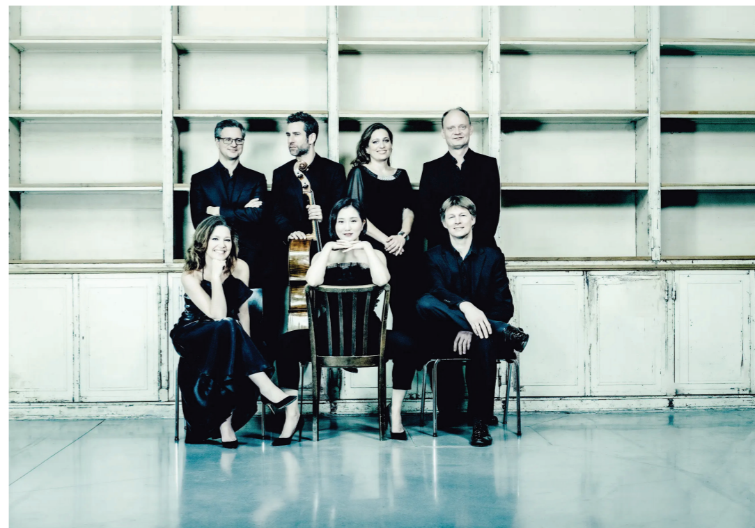
Alban Berg Ensemble Wien